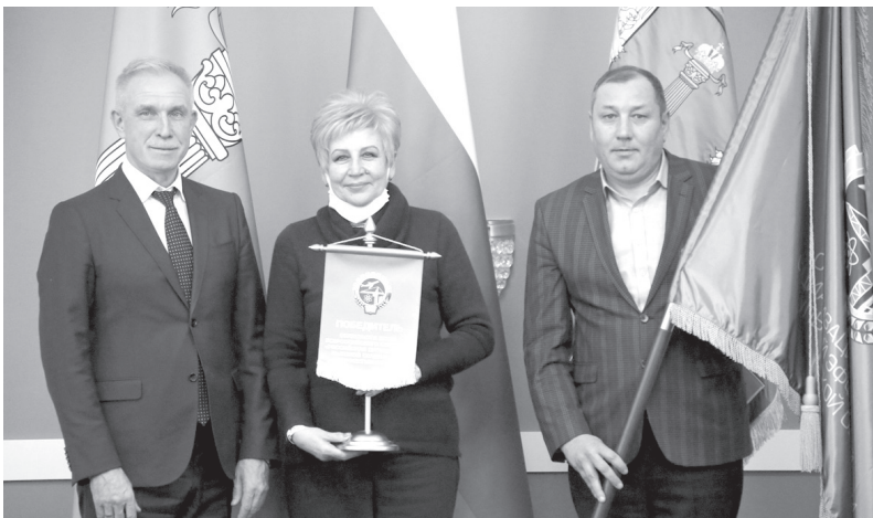
Сергей Морозов, губернатор Ульяновской области и победители в номинации «За вклад социальных инвестиций и благотворительности в развитие территорий» - АО «Контактор»

С 2021 года в Ульяновской области будет увеличен минимальный размер оплаты труда. Правительство региона, Федерация профсоюзов и объединения работодателей заключили соответствующее соглашение. Документ подписан 11 декабря на заседании областной трёхсторонней комиссии по регулированию социально-трудовых отношений.